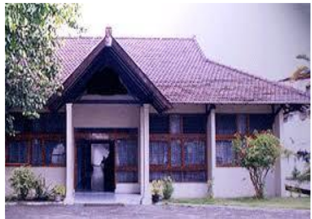
Balai Hiperkes dan KK

Disnakertrans DIY terdiri dari Dinas Induk dan 2 (dua) Unit Pelaksana Teknis Daerah (UPTD) yaitu :