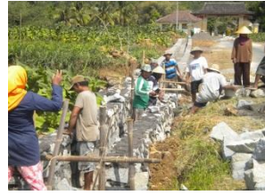
Padat Karya Infrastruktur