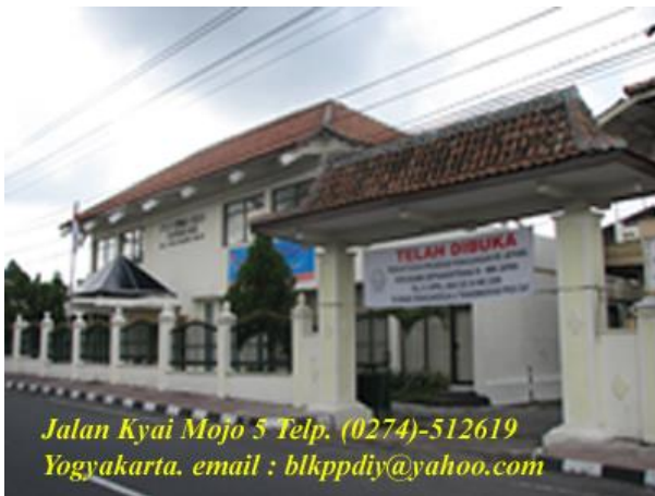
Balai Latihan Kerja dan Pengembangan Produktivitas DIY