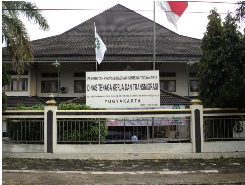
Kantor Disnakertrans DIY

Kantor Dinas Tenaga Kerja Provinsi DIY yang disingkat DTK diatur dalam Peraturan Pemerintah Nomor 14/1958 yaitu tentang penyerahan kekuasaan tugas kewajiban mengenai urusan-urusan kesejahteraan buruh, kesejahteraan penganggur dan pemberian kerja kepada penganggur di daerah. Pada jaman Hindia Belanda tepatnya pada tahun 1927 sudah ada kantor tersebut dikenal dengan nama "Arbeidsbemiddeling" yang artinya perantara kerja. Kemudian setelah Belanda menyerah kepada Jepang yaitu pada tahun 1942, kantor tersebut diganti oleh Jepang dengan nama "Sutigyokuyusisyo" yang berarti perantara kerja. Kemudian oleh Jepang diserahkan kepada lembaga yang bernama "Tpeas Perarta Prodjo" pada masa peralihan.