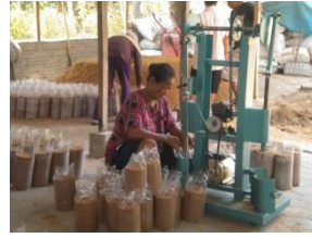
Teknologi Tepat Guna